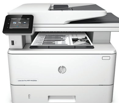
Urządzenie wielofunkcyjne HP LaserJet Pro M426fdn

Szybkie drukowanie, skanowanie, kopiowanie i faksowanie oraz zaawansowane, kompleksowe zabezpieczenia procesów roboczych. To urządzenie wielofunkcyjne zapewnia szybsze zakończenie podstawowych zadań i zapewnia ochronę przed zagrożeniami. 1 Oryginalne wkłady z tonerem HP z technologią JetIntelligence zapewniają wydruk większej ilości stron. 2