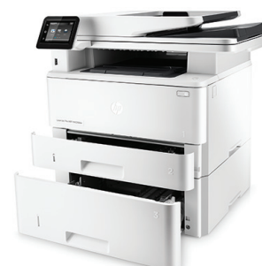
Urządzenie wielofunkcyjne HP LaserJet Pro M426fdw z opcjonalnym podajnikiem na 550 arkuszy